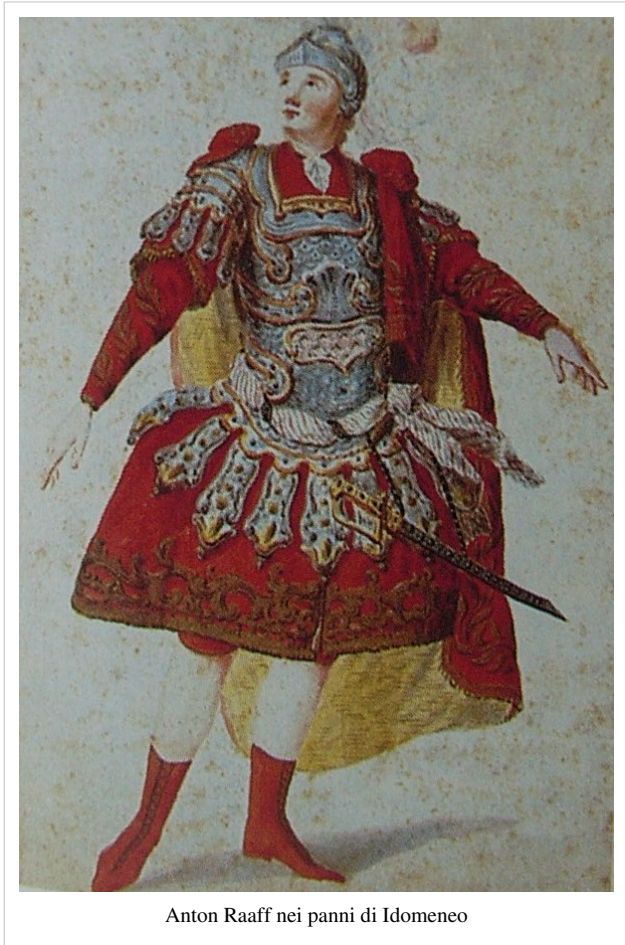
Anton Raaff nei panni di Idomeneo